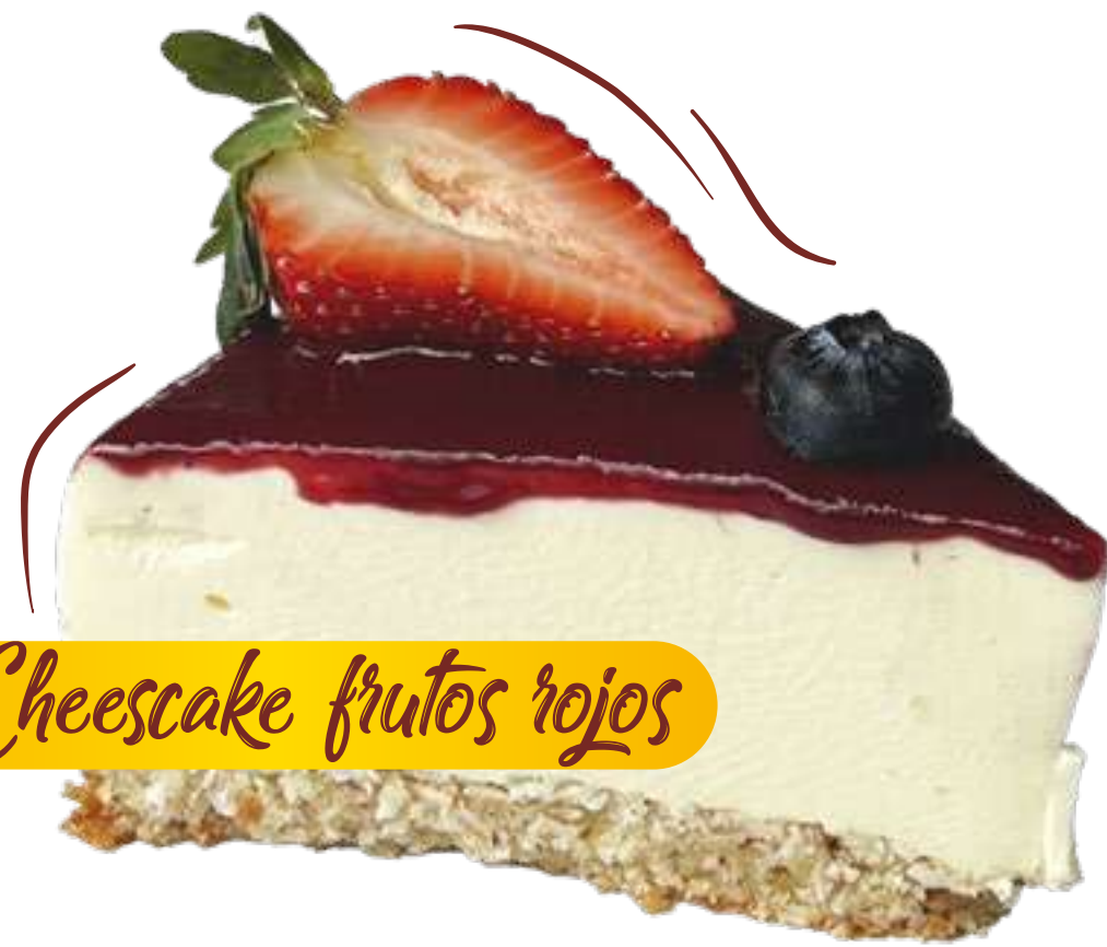
Cheesecake frutos rojos