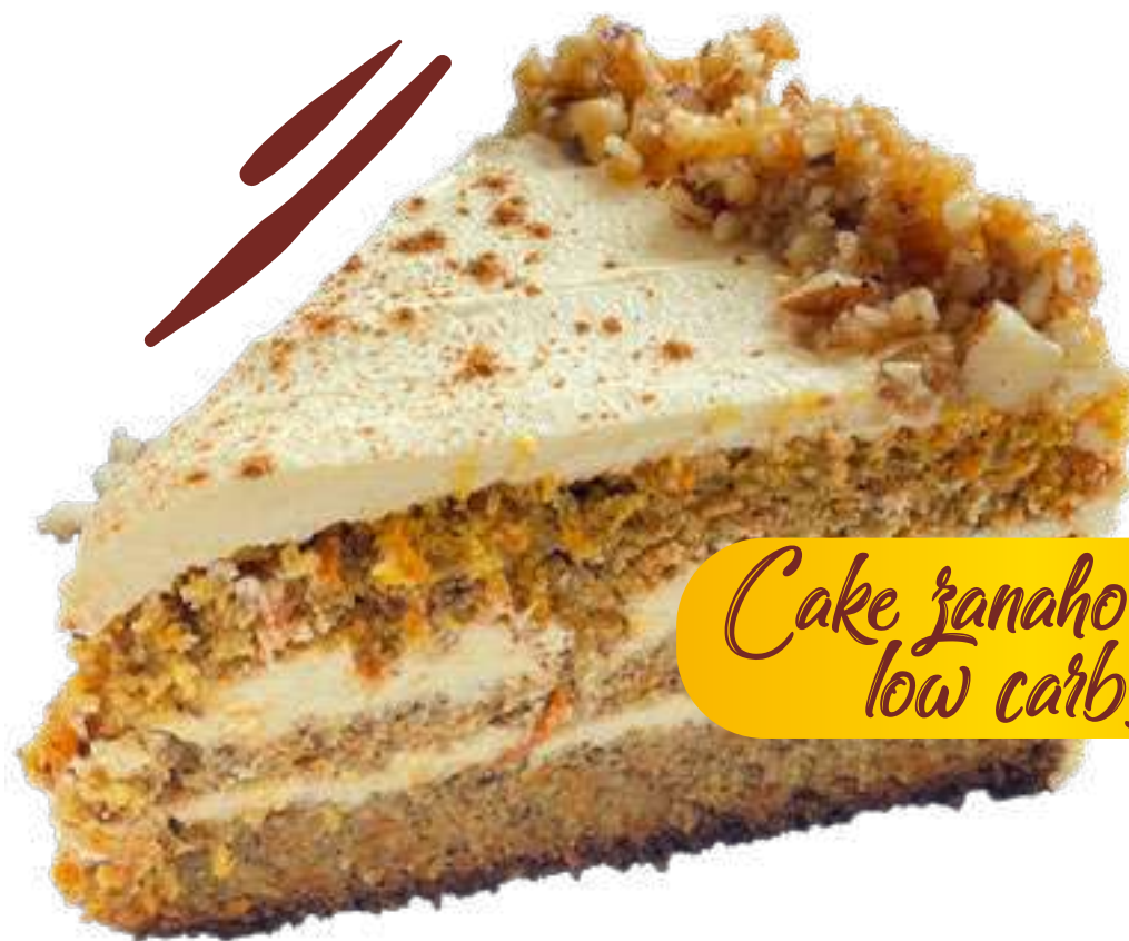
Cake zanahoria low carbs