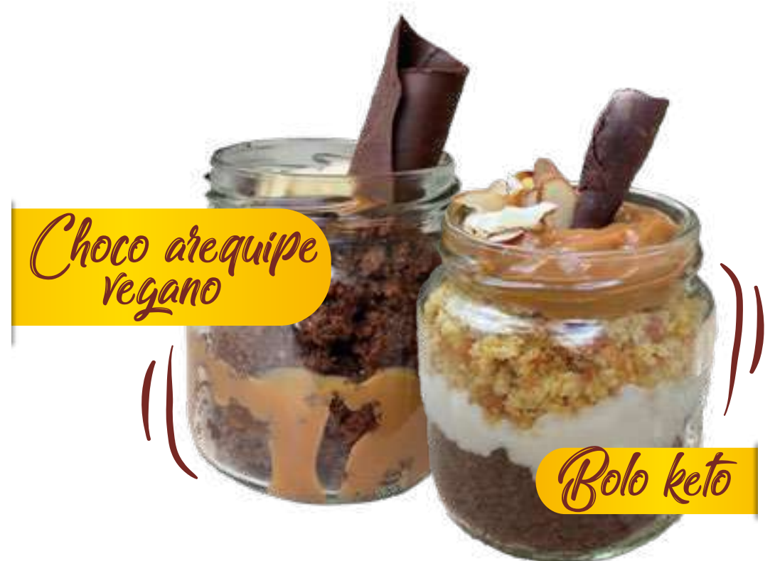
Choco arequipe vegano