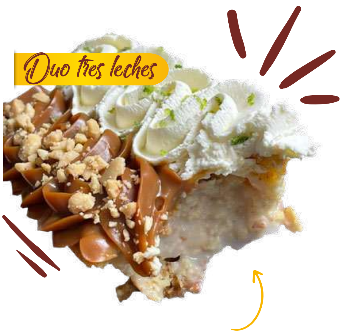
Duo tres leches