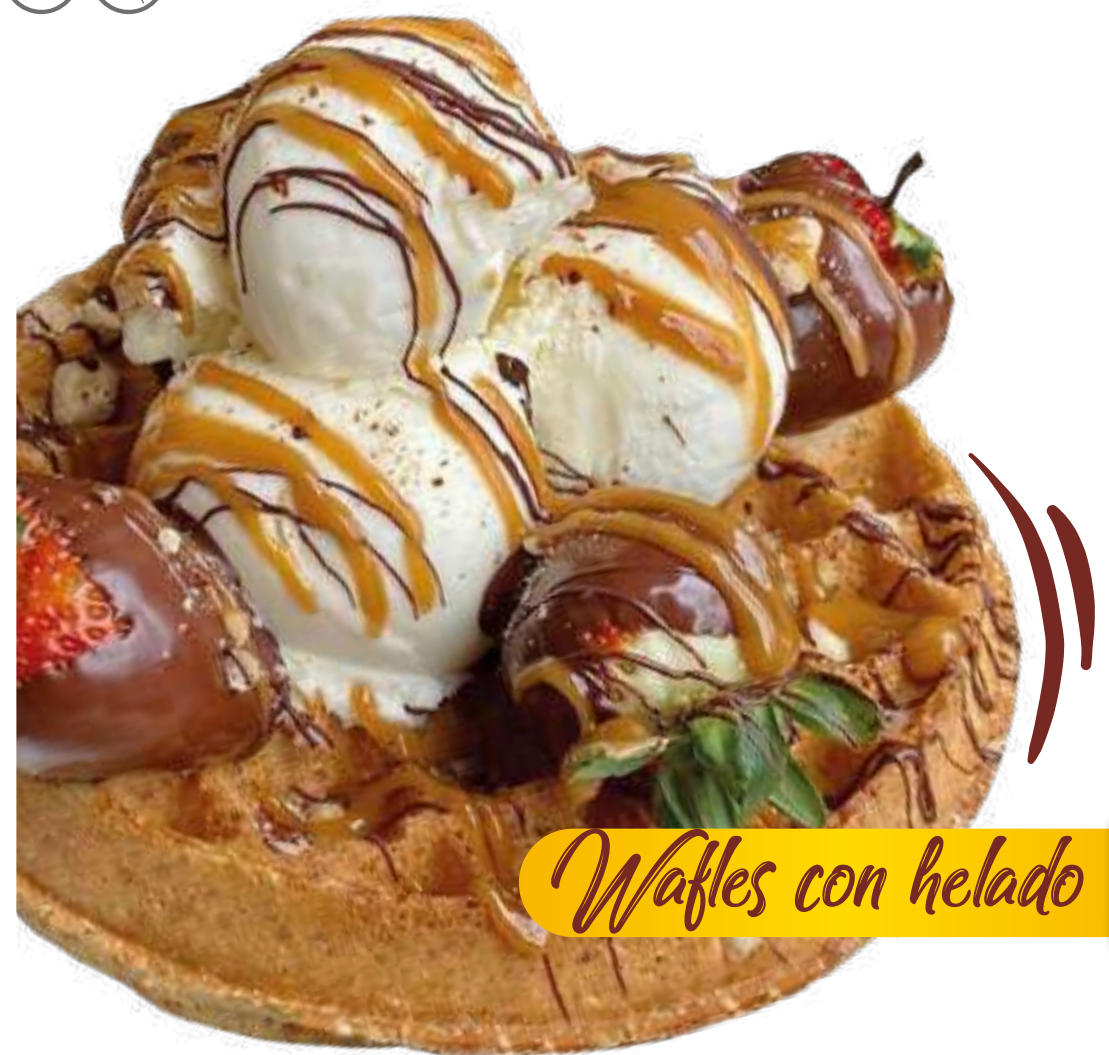
Waffles con helado